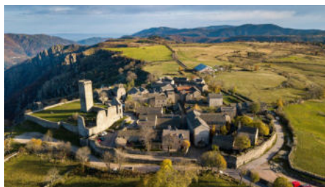
Le village médiéval de la Garde Guérin