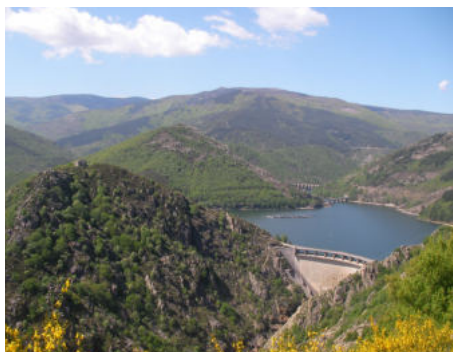
Le lac de Villefort et son barrage